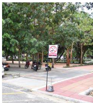
ห้ามรถยนต์วิ่งผ่านและห้ามจอด