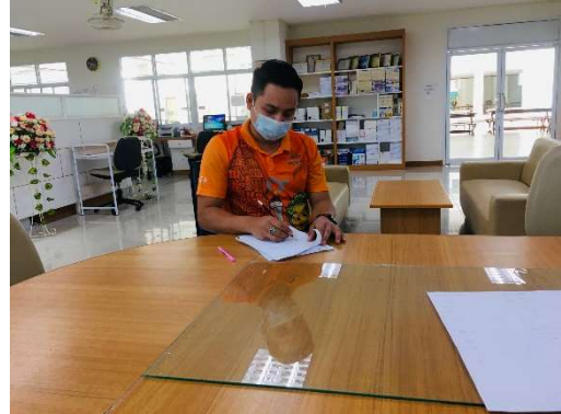
ฝ่ายรับเข้า แจ้งระบบสมัครและรายงานตัวแบบเดิม คือสามารถสมัครด้วยตนเอง หรือฝากก็ได้ แต่ต้องชำระค่าสมัครและค่ารายงานตัวที่การเงิน