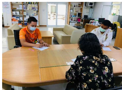
ฝ่ายรับเข้า ให้คำตอบสำหรับคำถาม ตั้งแต่ประกาศคุณสมบัติ หลักสูตร ค่าใช้จ่าย หลักฐาน ใบเสร็จรับเงิน ช่องทางการติดต่อ ฯลฯ