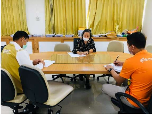
หัวหน้าสำนักงานฯ วางผังเว็บไซต์ ของรายละเอียด และลิงค์ที่เกี่ยวข้อง