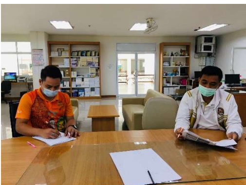
ฝ่ายแนะแนว กรองคำถามที่นักเรียนมักใช้สำหรับสอบถามข้อมูลในระหว่างการแนะแนวการศึกษา