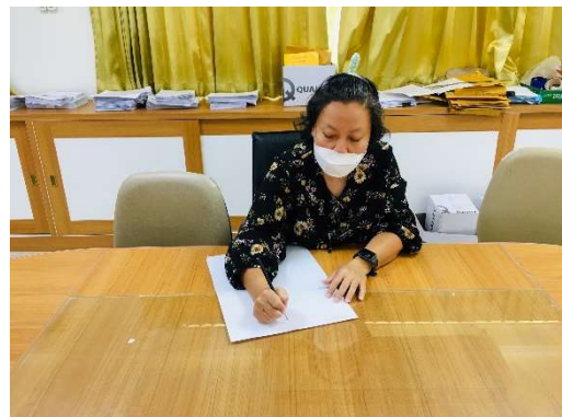
หัวหน้าสำนักงานฯ วางระบบทำเว็บไซต์รับสมัคร แจ้งรายละเอียด คำถาม คำตอบ สำหรับนักศึกษาที่ประสงค์จะสมัครและรายงานตัวออนไลน์