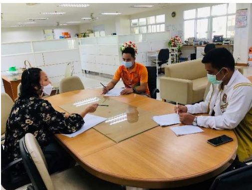
ฝ่ายรับเข้าและแนะแนว แจ้งว่าไม่สามารถรับเงินค่าสมัครและค่ารายงานตัวได้ เนื่องจากติดปัญหาที่ระเบียบการเงิน