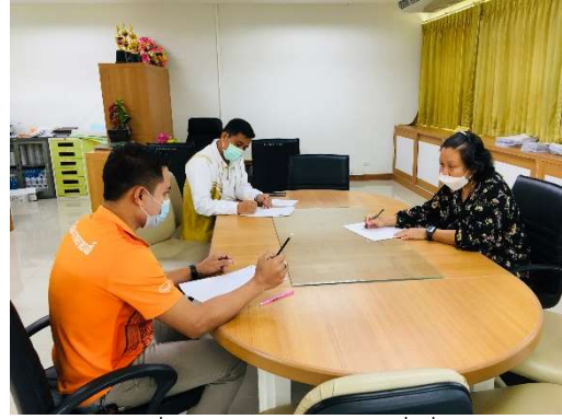
มอบหมายหน้าที่ประสานหน่วยงานที่เกี่ยวข้อง พัฒนา ปรับปรุง และตรวจสอบ เว็บไซต์รับสมัครนักศึกษาใหม่ เพื่อให้ใช้ได้ทันการเปิดรับรอบทั่วไป ปีการศึกษา 2565