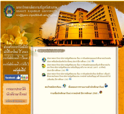
เว็บไซต์รับสมัครนักศึกษาใหม่